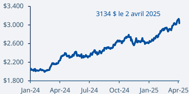
L'or atteint un nouveau sommet en avril en raison des droits de douane américains

US$/once troyenne.